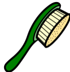
perie de păr